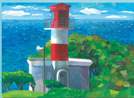
2018 小学生高学年金賞