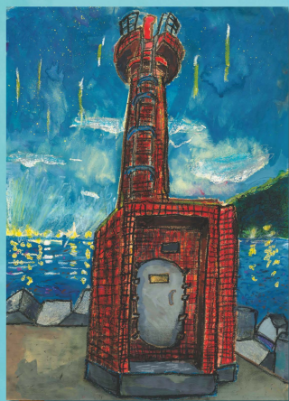
2018 小学生低学年金賞