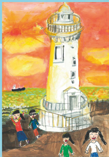
2018 海上保安庁長官賞